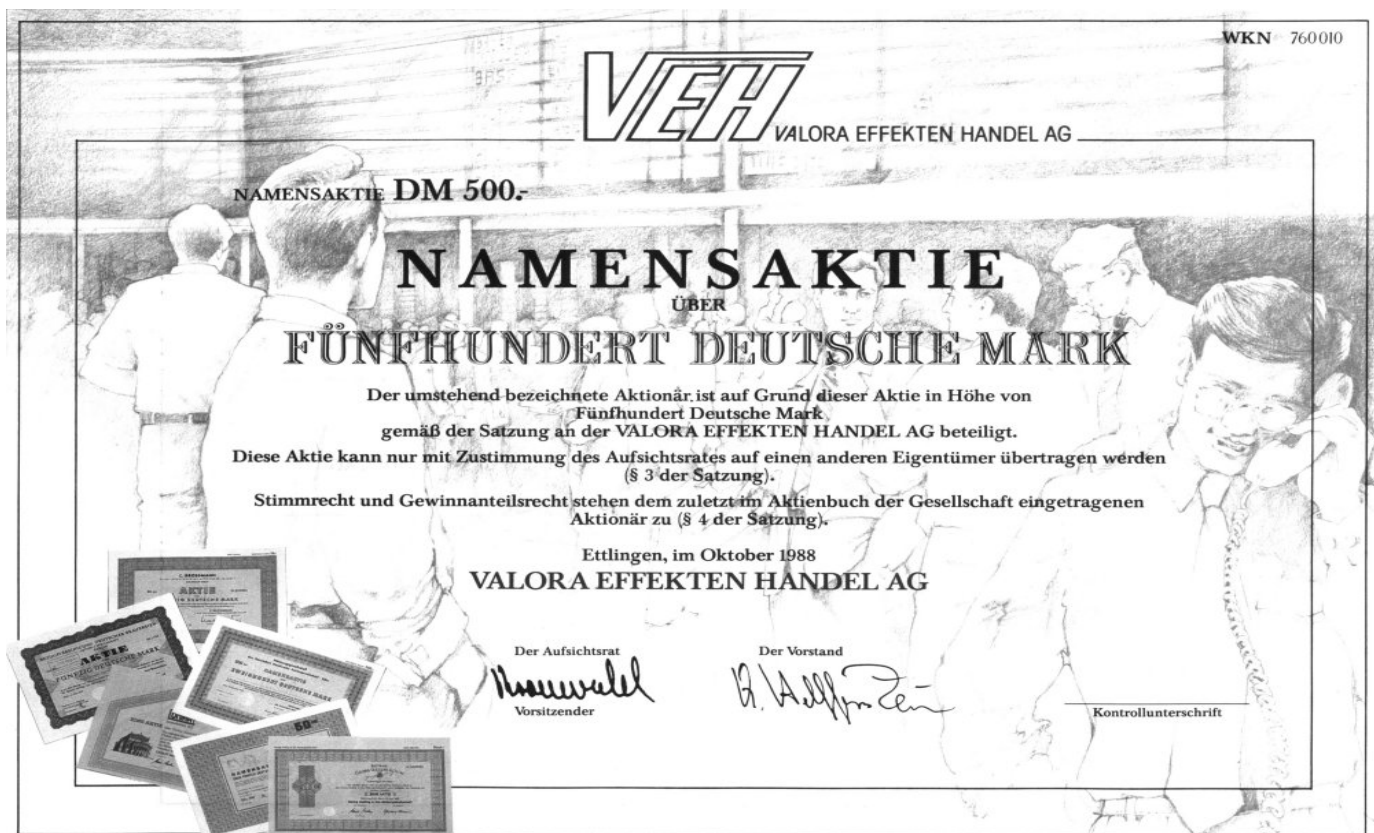
Abbildung der ehemaligen vink. Namensaktie der VEH AG